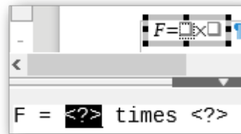
Abbildung 3: Ergebnis des Einfügens