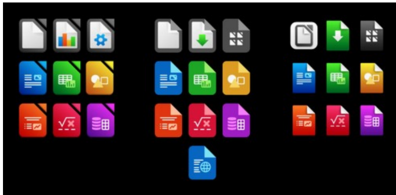
Abbildung 3: Neue Anwendungssymbole